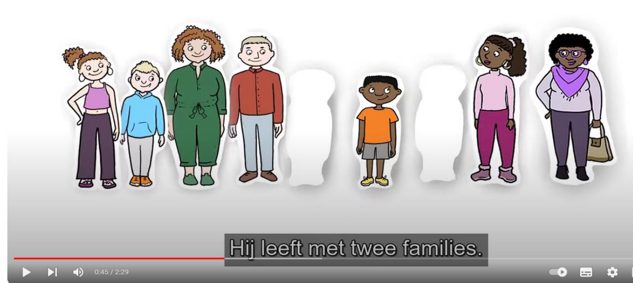
Leven met twee families